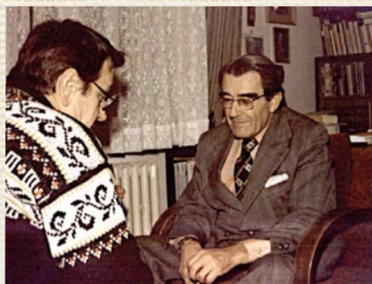
Rozhovor s priateľom Gustávom Valachom.