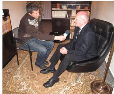
• František Mikloško v kresle Pavla Straussa