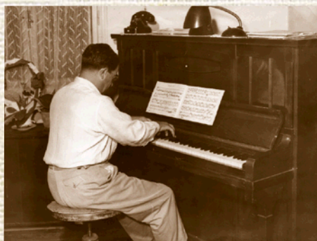
Za klavírom, 1966.

Degradovaný lekár, s výnimkou pár rokov aj umlčaný autor písuci do priečinka, pokorne znášal príkoria života. V Nitre postupne získal obdiv a úctu.