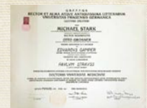
Lekársky diplom Nemeckej univerzity v Prahe, 1937.