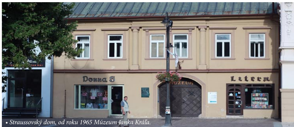
• Straussovský dom, od roku 1965 Múzeum Janka Kráľa.