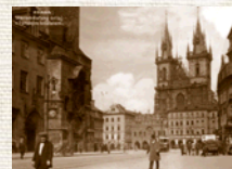
V Prahe prežil Pavol Strauss študentské roky, absolvoval vojenskú prezenčnú službu, etabloval sa ako básnik. Dozrel ľudsky i umelecky.

„Počas celého vysokoškolského štúdia som bol komunisticky orientovaný, i keď neorganizovaný, ale účastný na činnosti študentskej frakcie. V tom čase som žil mimo všetkého duchovného. Výjímne návštevy chrámových koncertov, nemal som styk s ničím náboženským. Mimosťudijný čas vyplňala hudba, koncerty, divadlo, čítanie a študentský politický život, ale vždy okolo kultúrno-umeleckej problematiky. Roku 1936 som sa dozvedel, že Stalin zakázal Sostakovičovi po návšteve jeho opery ďalšiu verejnú činnosť ako nesocialistickú a po čítaní Gidovej knihy o ZSSR som sa utiahol, dizgustovaný, zo študentského (spolkového) života a žil som len štúdiu, práci na klinike, čítaniu, klavíru...“