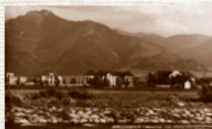
Aréál štátnej nemocnice v Palúdzke (dnes mestská časť Liptovského Mikuláša). Tu Pavol Strauss pracoval v rokoch 1940 – 1944.