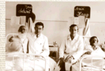
Na práci v pražskej fakultnej nemocnici.