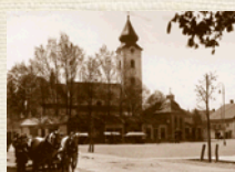
V Kostole sv. Mikuláša v Liptovskom Mikuláši prijal sviatosť krstu dva dni pred svojimi tridsiatimi narodeninami.