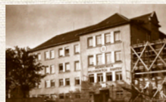
Nemocnica Milosrdných bratov v Skalici, druhá etapa výstavby v roku 1948.